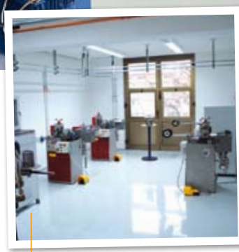
Die Halbzeugfertigung wurde vollumfänglich umstrukturiert.