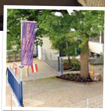
Die Infrastruktur wurde aufwändig modernisiert.