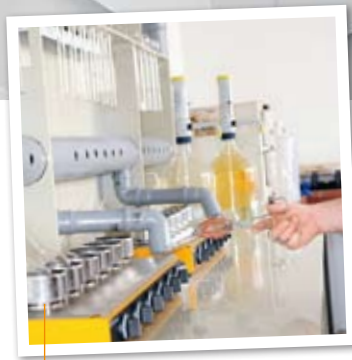
Das analytische Labor wurde vollständig um- und ausgebaut.