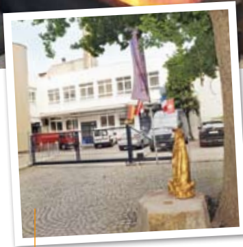
Unser Firmengebäude wurde komplett renoviert.